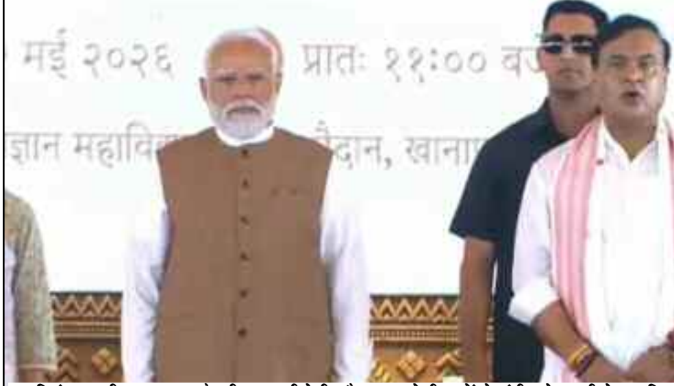
हिमंता दूसरी बार असम के सीएम: 2 बीजेपी और 2 सहयोगी दलों से मंत्री बने, सभी ने असमिया में शपथ ली; मोदी-शाह मौजूद रहे