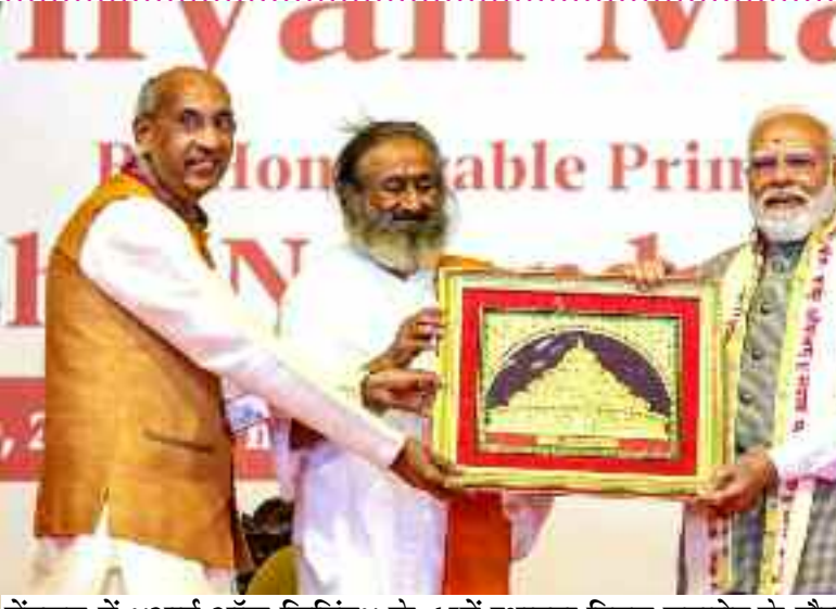
बेंगलुरु में %आर्ट ऑफ लिविंग% के 45वें स्थापना दिवस समारोह के दौरान, आध्यात्मिक गुरु श्री श्री रवि शंकर द्वारा प्रधानमंत्री नरेंद्र मोदी का अभिनंदन किया गया।

पुलिस थाने पर हमला किया और उन्हें रोकने के लिए पुलिस की ओर से भी गोलीबारी की गई। गोलीबारी में कम से कम तीन पुलिसकर्मीयों की मौत हो गई, जबकि कई घायल हो गए। खैबर पख्तूनख्वा के मुख्यमंत्री मोहम्मद सोहेल अफरीदी ने इस चरमपंथी हमले की कड़ी निंदा की और जान-माल के नुकसान पर गहरा दुख जताया। अफरीदी ने कहा कि आतंकवाद के विरुद्ध यह लड़ाई केवल खैबर पख्तूनख्वा की ही नहीं, बल्कि पूरे देश की है। उन्होंने यह भी कहा कि बंद कमरों में लिए गए फैसलों और थोपी गई नीतियों ने देश को असुरक्षा के दलदल में धकेल दिया है।