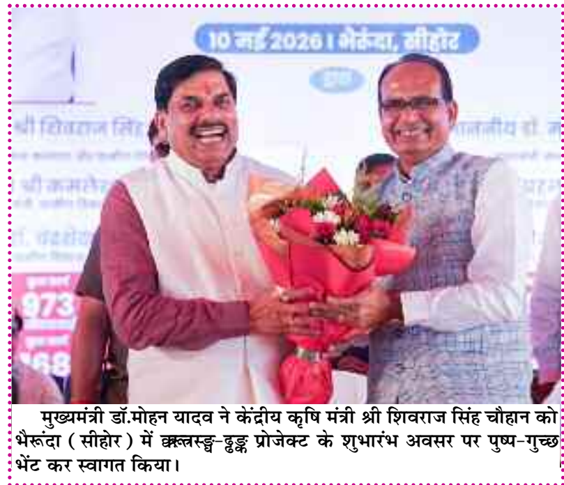
मुख्यमंत्री डॉ.मोहन यादव ने केंद्रीय कृषि मंत्री श्री शिवराज सिंह चौहान को भेरूदा (सीहोर) में क्लस्टर-डूडू प्रोजेक्ट के शुभारंभ अवसर पर पुष्प-गुच्छ भेंट कर स्वागत किया।

बीच एसी बंद मिलने पर उन्होंने नाराजगी जताई और अस्पताल प्रबंधन को एसी दुरुस्त कराने के निर्देश दिए। मंत्री तोमर ने दो टूक कहा कि अति-संवेदनशील वाडों में इस तरह की लापरवाही ठीक नहीं है। उन्होंने मौके से ही अस्पताल प्रभारी डा. प्रशांत नायक को फोन लगाकर तत्काल व्यवस्थाएं दुरुस्त करने के निर्देश दिए। मंत्री तोमर ने केवल मशीनों का ही नहीं, बल्कि मानव संसाधन का भी जायजा लिया। उन्होंने ड्यूटी पर मौजूद डाक्टर से सवाल किया कि रात के समय अस्पताल में कितना स्टाफ तैयार रहता है। इमरजेंसी में बैकअप की क्या तैयारी है। क्या सभी जरूरी जीवन रक्षक दवाएं स्टॉक में उपलब्ध हैं।