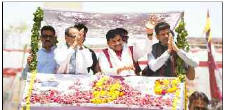
मुख्यमंत्री डॉ.मोहन यादव ने सीहोर जिले के मैरुंदा में रोड शो कर जनता का अभिवादन किया।

उन्होंने आरोप लगाया कि कांग्रेस सरकार के समय तत्कालीन मुख्यमंत्री कमलनाथ द्वारा ओबीसी वर्ग को 27 प्रतिशत आरक्षण देने का ऐतिहासिक निर्णय लिया गया था, लेकिन भाजपा सरकार ने जानबूझकर इस आरक्षण को लागू नहीं होने दिया। उन्होंने कहा कि सरकार द्वारा अदालत में प्रभावी पैरवी नहीं की गई, बार-बार वकीलों के पैसल बदले गए, कई बार सुनवाई के दौरान सरकारी पक्ष के वकील उपस्थित तक नहीं हुए और ऑनलाइन पेशियों के माध्यम से मामले को गंभीरता से नहीं लिया गया। यह पूरी स्थिति भाजपा सरकार की ओबीसी विरोधी मानसिकता को दर्शाती है।